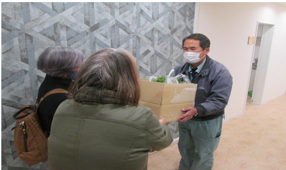
野菜をお届けした時の様子

「葉ッピーファーム」が地域の子どもたちに少し貢献できたような気がします。今後も毎月第1土曜日に継続して野菜を提供していきたいと思っています。